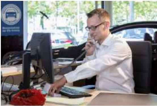
Die Kraftfahrzeugbranche bietet gute Karrieremöglichkeiten auch im kaufmännischen Bereich.