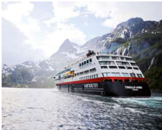
Die norwegische Küste ganz neu erleben: Ab sofort können zwei neue Seereisen mit dem modernisierten Postschiff MS Trollfjord gebucht werden.

Aufenthalt auf dem Programm. Für die Saison 2023/2024 können die neuen Linien ab sofort unter www.hurtigruten.de oder im Reisebüro gebucht werden. Gleiches gilt für die klassische Postschiffroute. (djd/sel)