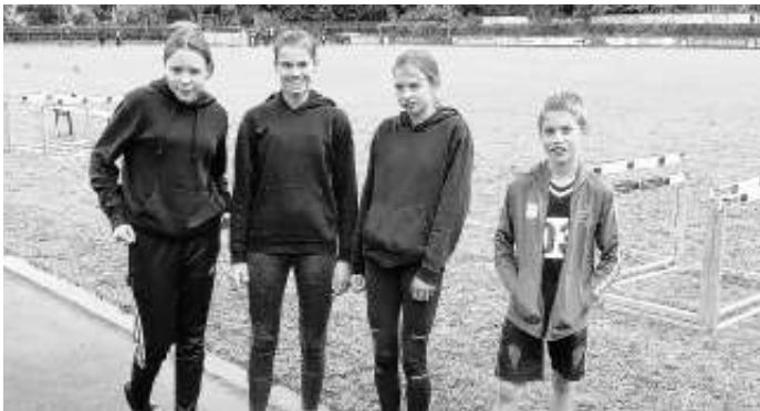
4 Altdorfer und alle mit Titelgewinn bei den Kreismeisterschaften

Trotz niedrigster Wetterbedingungen machte sich eine kleine Gruppe von 4 Altdorfer Athleten am letzten Wochenende auf zu den Kreis-Mehrkampfmeisterschaften der Schüler in Eltingen.