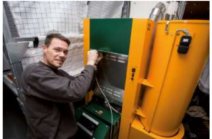
Eine Pelletheizung braucht ungefähr den gleichen Platz wie eine Ölheizung. Die kleinen Holzpresslinge sind jedoch deutlich klimafreundlicher, der Einbau einer Pelletheizung wird deswegen vom Staat durch hohe Zuschüsse gefördert.

Der Staat übernimmt beim Einbau einer Pelletheizung einen erheblichen Kostenanteil: In der