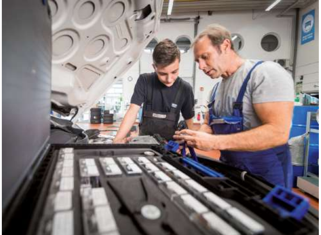
Eine Ausbildung im Kfz-Gewerbe eröffnet vielfältige Berufsbilder und Karriereoptionen.

Die Branche bietet eine Vielzahl von Einstiegs- und Aufstiegsmöglichkeiten. Wer etwas mit Autos, motorisierten Zweirädern oder Lkws machen möchte, kann klassisch über den dualen Bildungsweg aus betrieblicher Ausbildung und Berufsschule in technische und kaufmännische Laufbahnen einsteigen. Unter www.wasmitautos.com finden Interessierte Informationen und Tipps rund um Ausbildungen und berufliche Ent-