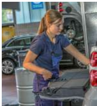
Berufe in der Kfz-Branche leisten einen wichtigen Beitrag zur Mobilität der Gesellschaft.

Karrierechancen durch Spezialisierung und Höherqualifizierung Dazu werden die Perspektiven aufgezeigt, die sich für die Berufseinsteiger nach dem erfolgreichen Ausbildungsabschluss eröffnen. So bringt bereits eine zweijährige Weiterbildung Spezialisierungen innerhalb des gewählten Ausbildungsberufs hervor, etwa den geprüften Kfz-Service-Techniker, geprüften Automobil-Verkäufer oder -Serviceberater sowie weitere Kfz-spezifische Qualifizierungen. Darüber hinaus steht auch der Weg zu Führungspositionen oder zur Selbstständigkeit offen. Der klassische Meister etwa kann zum Werkstattmanager oder Betriebsleiter aufsteigen, einen Betrieb übernehmen oder selbst einen gründen. Auch akademische Abschlüsse bis zum Bachelor oder Master of Business Administration in technischen und kaufmännischen Studiengängen liegen in Reichweite.